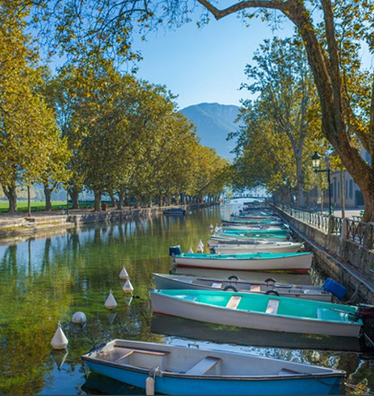
Les Cars de la Région Auvergne-Rhône-Alpes

Du 04 Septembre 2023 au 01 Septembre 2024